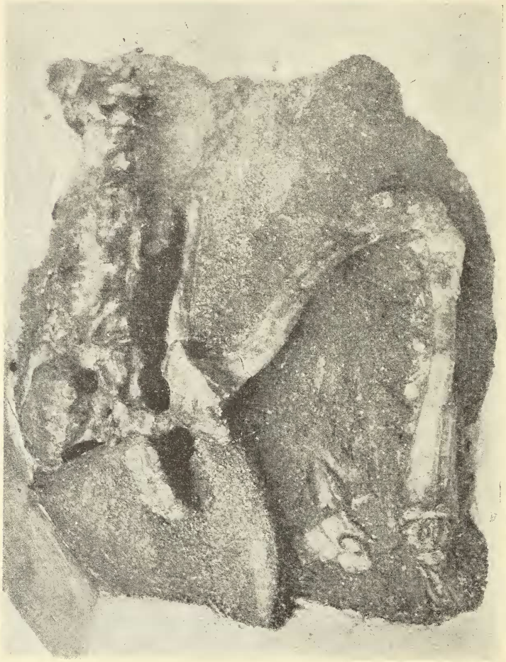
Microsuchus Schilleri . Ejemplar tipo. Tamaño natural

Goniofólido unas placas epidérmicas que corresponden a la región dorsal y otras a la ventral. Las primeras tienen forma rectangular y puede verse cómo se hacen más pequeñas las que son más caudales.